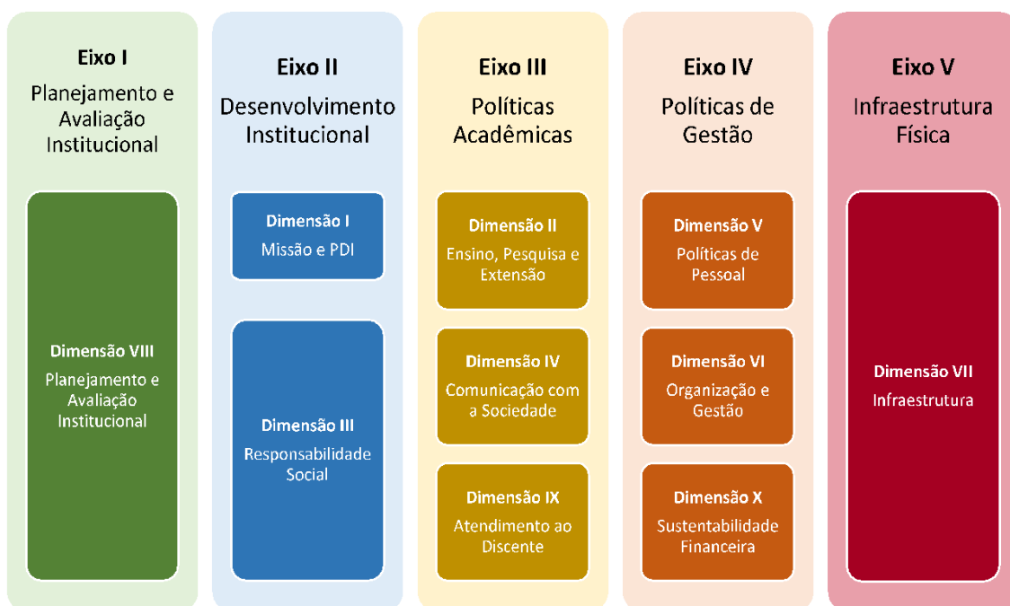
Figura 3 – Eixos e dimensões do SINAES

Essa autoavaliação, realizada em todos os cursos da IES, a cada semestre, de forma quantitativa e qualitativa, atenderá à Lei do Sistema Nacional de Avaliação da Educação Superior (SINAES), nº 10.8601, de 14 de abril de 2004. A legislação irá prevê a avaliação de dez dimensões, agrupadas em 5 eixos, conforme ilustra a figura a seguir.