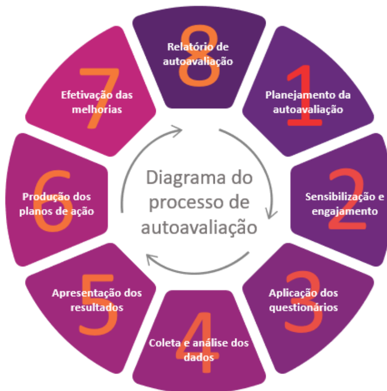
Figura 4 – Diagrama do Processo de Autoavaliação

O processo de autoavaliação da Universidade Anhembi Morumbi foi idealizado em oito etapas, previstas e planejadas para que seus objetivos possam ser alcançados, conforme explicitado a seguir.