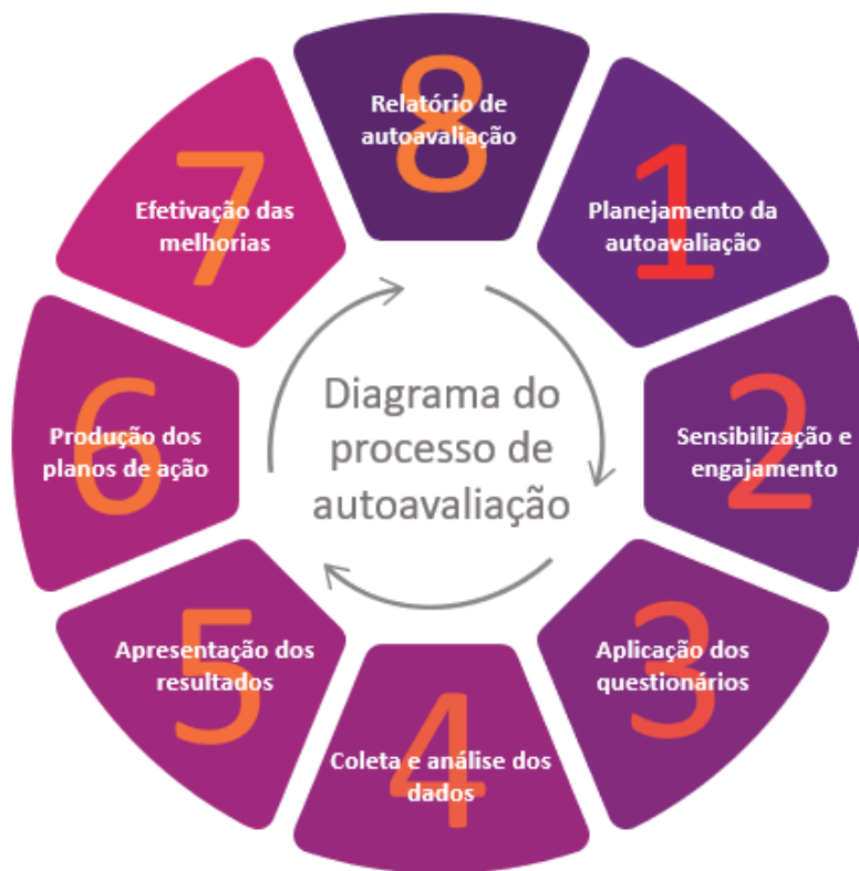
Figura 5 – Diagrama do Processo de Autoavaliação

O processo de autoavaliação da Universidade Anhembi Morumbi foi idealizado em oito etapas, previstas e planejadas para que seus objetivos possam ser alcançados, conforme explicitado a seguir.