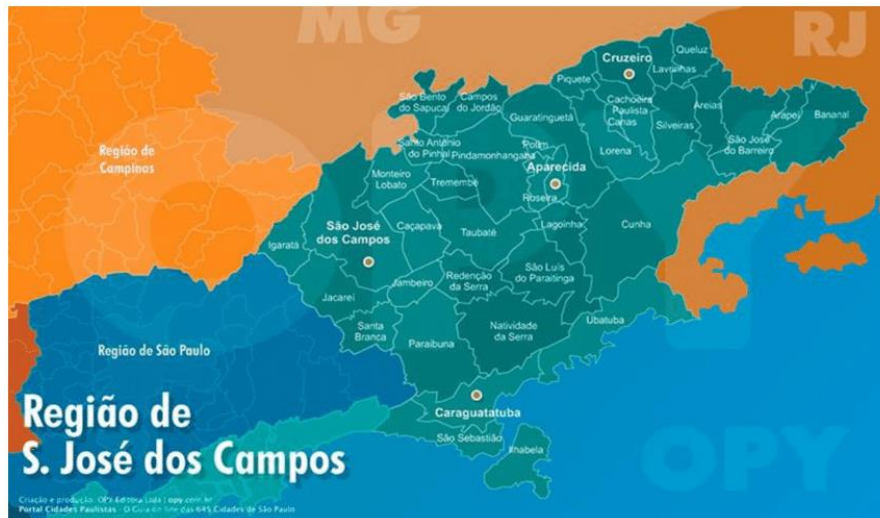
Figura 1 – Mapa da região administrativa de São José dos Campos