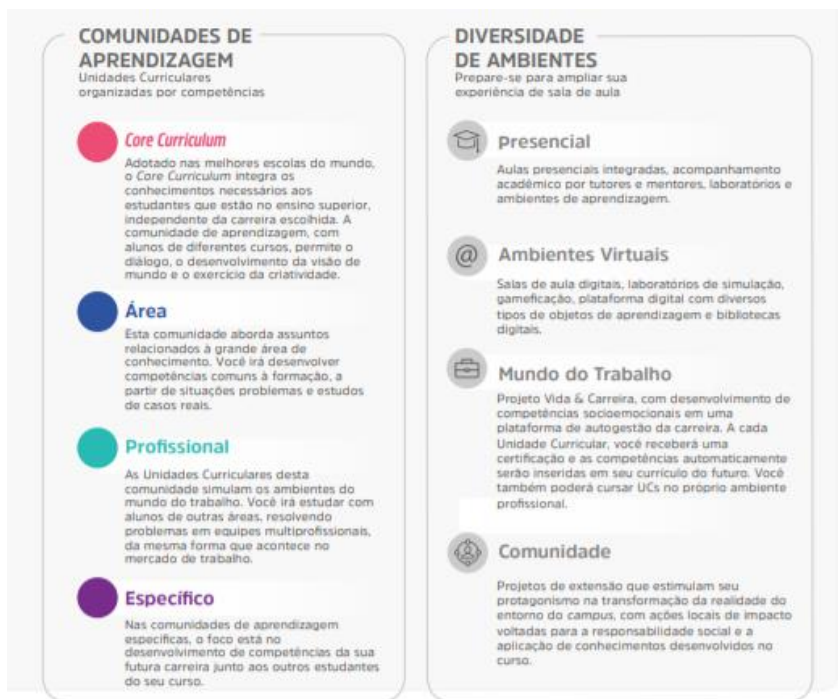
Figura 1 – Comunidades de aprendizagem e diversidade de ambientes

A flexibilidade do Currículo Integrado por Competências permite ao estudante transitar por diferentes comunidades de aprendizagem alinhadas aos seus respectivos eixos de formação. O percurso formativo é flexível, fluído, e ao final de cada unidade curricular o aluno atinge as competências de acordo com as metas de compreensão estudadas e vivenciadas ao longo do semestre.