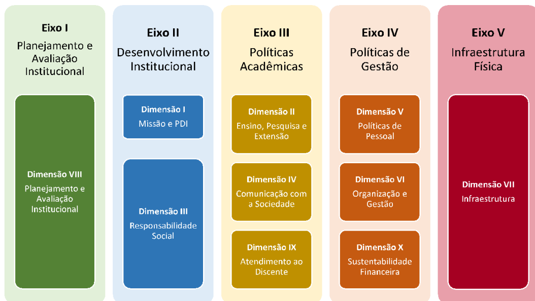
Figura 1 – Eixos e dimensões do SINAES

Essa autoavaliação, realizada em todos os cursos da IES, a cada semestre, de forma quantitativa e qualitativa, atenderá à Lei do Sistema Nacional de Avaliação da Educação Superior (SINAES), nº 10.8601, de 14 de abril de 2004. A legislação irá prever a avaliação de dez dimensões, agrupadas em 5 eixos, conforme ilustra a figura a seguir.