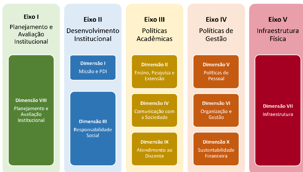
Figura 1 – Eixos e dimensões do SINAES

Essa autoavaliação, realizada em todos os cursos da IES, a cada semestre, de forma quantitativa e qualitativa, atenderá à Lei do Sistema Nacional de Avaliação da Educação Superior (SINAES), nº 10.8601, de 14 de abril de 2004. A legislação irá prever a avaliação de dez dimensões, agrupadas em 5 eixos, conforme ilustra a figura a seguir.