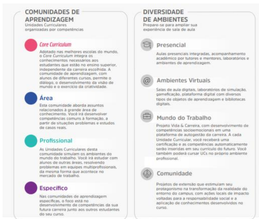
Figura 1 – Comunidades de aprendizagem e diversidade de ambientes

A flexibilidade do Currículo Integrado por Competências permite ao estudante transitar por diferentes comunidades de aprendizagem alinhadas aos seus respectivos eixos de formação. O percurso formativo é flexível, fluído, e ao final de cada unidade curricular o aluno atinge as competências de acordo com as metas de compreensão estudadas e vivenciadas ao longo do semestre.