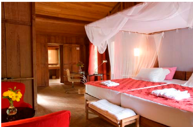
Figura 1: Interior de um dos quartos do hotel

luxo presente nos detalhes de madeira do mobiliário, nas cortinas de seda, taças de cristal, lençóis de algodão egípcio e jogos americanos de renda richelieu, vinhos da enoteca Fasano. A excelência também se dá na experiência personalizada. Não se limitam os horários para refeição ou para check-in e check-out e, para a comunicação entre hóspedes e funcionários em todas as áreas do hotel, é disponibilizado um rádio a cada um.