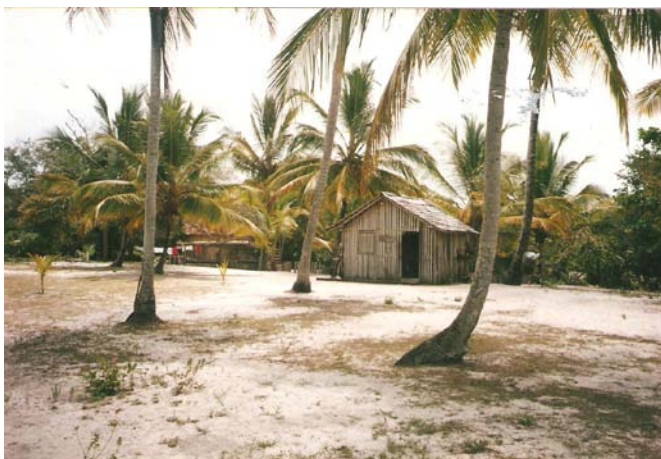
Figura 2: Vista do terreno enquanto ainda era fazenda

Foram 12 anos de observação e interação com a região para construir o hotel na linguagem das casas da vila, adaptar o projeto às características e potencialidades locais. Neste processo, um personagem importante foi o pescador e poeta local Honorato Deocleciano, que ajudou a recuperar o caminho de formação da cultura do vilarejo.