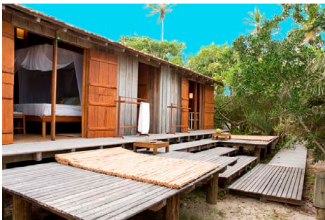
Figura 5: Quartos em palafitas, interligados por passarelas