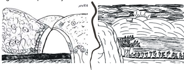
Figura 1 – Representações da Serra do Mar.

Alguns artesãos expressaram seus sentimentos através de desenhos (fig.1) e outros pela escrita (fig.2).