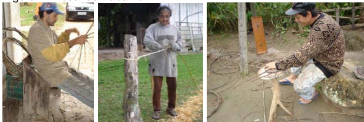
Figura 4 – local de trabalho.

Participando do cotidiano e compartilhando do saber fazer destes artesãos percebe-se que vivenciam um processo de afirmação de identidades, que se apresenta desde: a forma de extração da matéria prima; as técnicas de trançado; a circulação dos artefatos; a localização das moradias (que também são os locais de trabalho destes artesãos) (fig.4); mas, especialmente, na busca de reconhecimento e entendimento de seu trabalho.