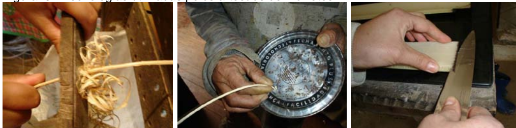
Figura. 3 - Tecnologias utilizadas pelos artesãos de Morretes.

aprendizado pela prática, as tecnologias que são repassadas pelas gerações e a simplicidade na solução de problemas cotidianos, apontam para a necessidade de manter um vínculo com a tradição e estilo de vida que respeita a natureza humana e ambiental.