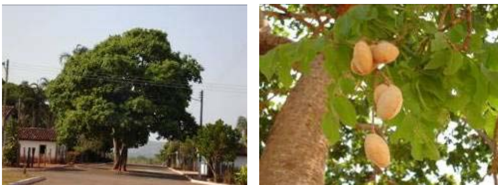
Figuras 01 e 02: O “baruzeiro” é uma árvore que pode atingir 25 metros de altura

A árvore produz frutos anualmente. Esses frutos, ao cair, são coletados pela população que utiliza principalmente a castanha, apesar do fruto conter uma polpa nutritiva e doce. O fruto, de