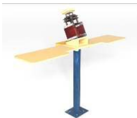
Figura 11: Versão que foi construída em aço e madeira

Após a construção do “ mock-up ” foi confeccionada uma bancada em placa de fibra de madeira conhecida como MDF (Medium-Density Fiberboard), para a realização de testes. Essa bancada tem uma altura menor do que a do “ mock-up ” e na parte superior foi instalado o protótipo em metal. A inclinação mostrada na figura 20 tem o objetivo de facilitar a visibilidade na operação de inserir o fruto na mesa de quebra. Baseando-se nos testes do “ mock-up ”, se desenvolveu uma versão que foi construída em aço e madeira (Figura 11).