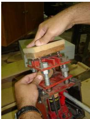
Figura 10: Peça em madeira e aço, que permite abaixar a mesa por igual, mantendo-a na horizontal

Verificou-se também que o rebaixo esmerilhado para posicionamento do fruto não tinha profundidade suficiente para alojar a semente em posição perpendicular à mesa. Isso foi posteriormente resolvido aprofundando-se o rebaixo. Após a operação anteriormente citada, ao se aplicar força através do cilindro, notou-se que a mesa flexionava-se. Para resolver o problema foi feita uma peça em aço para servir de reforço à chapa, a qual se soldou à porção central da mesa que constituía a parte frágil.