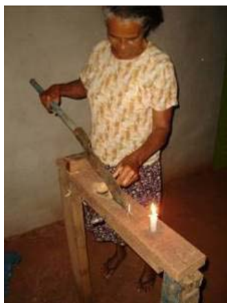
Figura 05: Foice adaptada sobre uma estrutura de madeira onde pressão é aplicada para cortar o invólucro lenhoso

Os equipamentos encontrados para retirar a castanha, variavam desde um simples machado para, através do impacto, quebrar o invólucro, a uma foice adaptada sobre uma estrutura de madeira, onde pressão é aplicada para cortar o invólucro lenhoso (Figura 05).