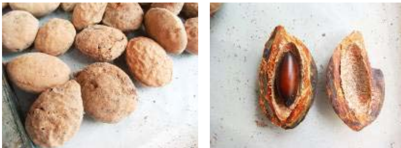
Figuras 03 e 04: Fruto e invólucro lenhoso com a castanha.

Os entrevistados revelaram que as principais dificuldades na abertura da castanha estavam relacionadas a problemas de higiene e segurança no trabalho. Por exemplo, no caso de uma das máquinas registradas em uso, é necessário aplicar muita força na alavanca. A repetição dessa tarefa, segundo relatos, causa dor nos braços durante todo o dia. Outro problema, é que o corte dos frutos mais secos produz poeira fina, que fica em suspensão e é inalada pelo operador.