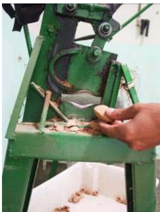
Figura 06: Equipamento mais sofisticado construído em aço e utilizando lâminas para cortar o fruto

Após a análise das máquinas existentes descritas anteriormente, alguns conceitos foram concebidos e um deles selecionado e desenvolvido. Desde o início decidiu-se utilizar um cilindro hidráulico como meio multiplicador de força, já que é um sistema simples de se adquirir, de baixo custo, confiável, durável e, acima de tudo, compacto. No caso em questão utilizou-se um macaco de aplicação veicular.