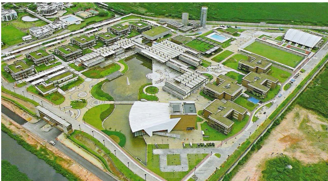
Figura 2 – Foto aérea da Escola Sesc de Ensino Médio (GRISOLLI, 2009).

Pelo formato e metragem do terreno, percebe-se que a distância máxima percorrida por um pedestre de um lado ao outro, não será superior a meio quilômetro, portanto, a solução adotada para os veículos e as bicicletas foi de circulação periférica, deixando aos pedestres um caminho ora sinuoso, ora direto, diluído entre os elementos arquitetônicos, com espaços de lazer e mobiliários urbanos. Também foi previsto, desde o projeto inicial, o acesso para as pessoas com necessidades especiais, o que lhes permite transitar livremente pelo educandário.