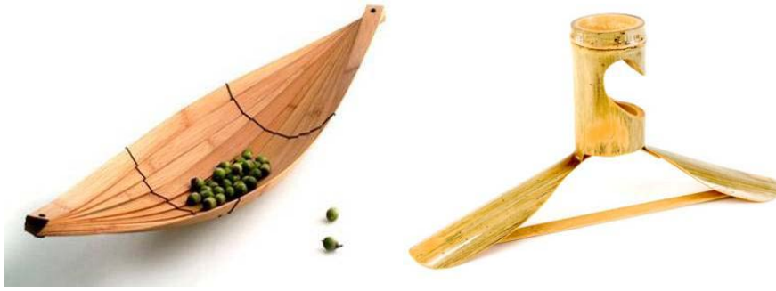
Figura 3 e 4: Produtos com design e apelo estético